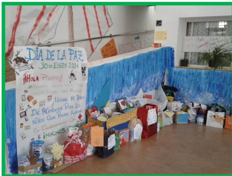
Aportaciones de alimentos por parte de los padres en la Escuela Infantil Parque Coímbra.